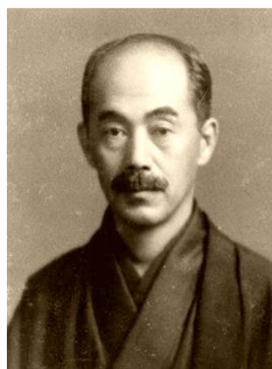
Кунио Янагита (柳田國男, 1875—1962), деятель науки и образования, философ, краевед, фольклорист.

Основным идейным источником этнического национализма стала трансформированная версия концепции кокутай, из которой была убрана фигура императора. И поскольку в содержательном плане речь можно было вести только о народе, новая версия национализма сформировала национальную идентичность в ее современном виде, сфокусированном на поиске уникальности японцев. Родоначальником этнического национализма считается исследователь японского фольклора Янагита Кунио (1875—1962). Находясь на государственной службе, он был вынужден путешествовать по различным удаленным уголкам Японии, где и начал изучать и записывать фольклорную традицию простых людей. Свои заметки он публиковал в основанных им же журналах «Исследования деревни» (1913—1917 гг.), «Этнография» (1925—1929 гг.) и др. Если изначально его исследования носили научный характер, сделав его предтечей японской этнографии, то в дальнейшем он все больше уходил в сторону описания японского национального характера, который лег в основу этнического национализма.