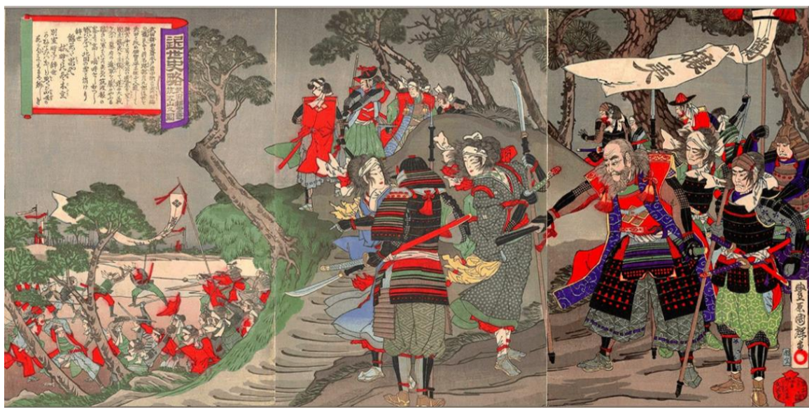
Вооруженные сторонники школы Мито под знаменем Сонно Дзэи (尊皇攘夷) — японского политического движения эпохи Эдо, название которого происходит от лозунга «Да здравствует император, доллой варваров!», взятого из теории об абсолютной лояльности к императору (尊皇論, сонно рон) и требования изгнания варваров — европейцев и американцев. Гравюра XIX в.

В рамках представлений школы японскими добродетелями признаются конфуцианские этические категории пиетета и общественной лояльности. Главную задачу ученые школы видели в распространении националистических идей среди простых людей ради укрепления страны против идеологического воздействия западных культур, а в последствие и для поддержания морального духа в борьбе за независимость.