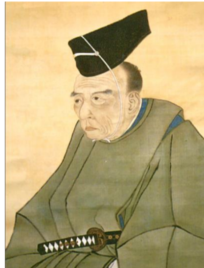
Аидзава Сэйсисай (会沢正志齋, настоящее имя Аидзава Ясуси, 会沢安, 1782—1863), философ, конфуцианец, политический деятель периода Эдо.