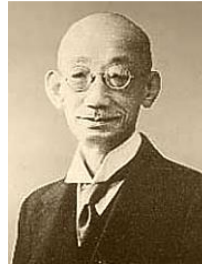
Теоретики японского государственного национализма, слева направо: Фукудзава Юкити (福澤諭吉, 1835—1901), писатель, переводчик и философ, основатель университета Кэйю, первый президент Токийской академии (ныне Японская академия наук); Иноуэ Тэцудзиро (井上 哲次郎, 1855—1944), философ; Минобэ Тацукити (美濃部 達吉, 1873—1948), государственный деятель и правовед, исследователь конституционного права