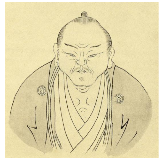
Наиболее известные представители школы кокугаку эпохи Эдо: слева направо: буддийский монах Кэйтю (契沖, 1640—1701); Када Адзумамамаро (荷田 春満, 1669—1736), японский поэт и филолог; Мотоори Норинага (本居 宣長, 1730—1801), японский ученый и философ; Хирата Ацутанэ (平田篤胤, 1776—1843), японский ученый, один из самых значительных теологов школы синто

Путь Японии определяется учеными кокугаку как следование правилам и обычаям, заложенными до принятия буддизма. К ним относятся выражение поддержки императору и беспрекословное следование его указам. Согласно ученым школы, единственно возможным гармоничным существованием государства является взаимосвязь императора и народа, где последний впервые представлен без сословных различий. В этой взаимосвязи император отвечает за судьбу народа, а народ предан воле императора.